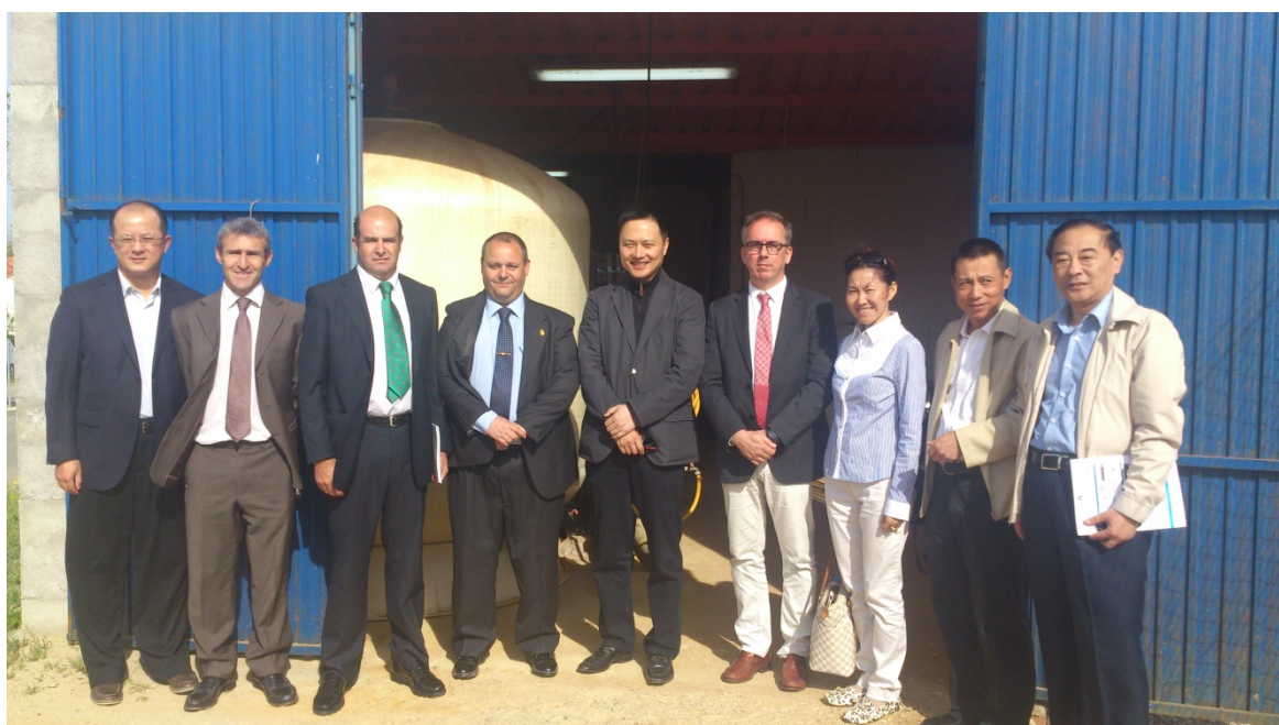
DELEGACION DE LA AGENCIA ESTATAL DEL AGUA DE CHINA

EL GOBIERNO DE CHINA Y EMPRESARIOS DE FRANCIA SE INTERESAN POR EL SISTEMA DE POTABILIZACION DE AGUA DE CONSUMO DE VILLAMIEL DE TOLEDO